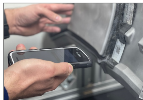
Abbildung 1 Scannen einer Bauteil-ID