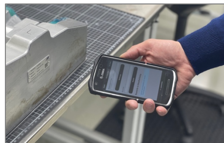
Abbildung 2 Scannen eines Werkzeugs