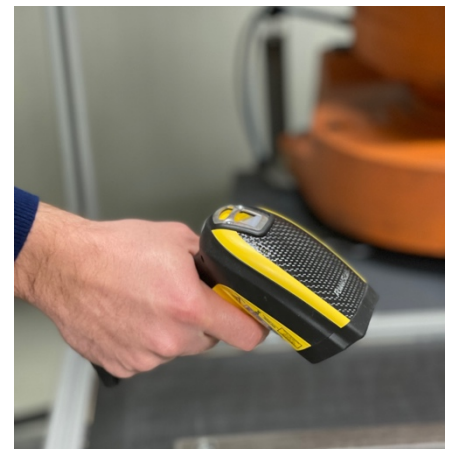
Abbildung 4 Unterstützung durch handelsübliche Scanner

Profitieren Sie von Ihren individuellen Bauteil-Berichten und lassen Sie uns Ihr individuelles Berichtswesen gestalten. Ihre Zahlen auf einen Blick. Auf Wunsch richten wir ihnen auch eine Power BI Schnittstelle ein. Somit sind ihnen keine Grenzen mehr gesetzt ihre Daten auszuwerten.